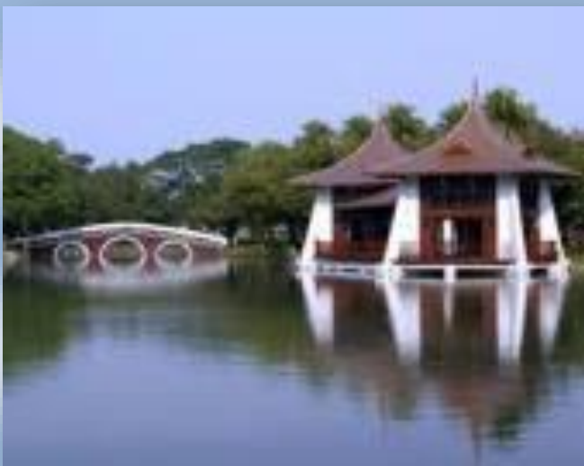
←台中市にある台中公園です