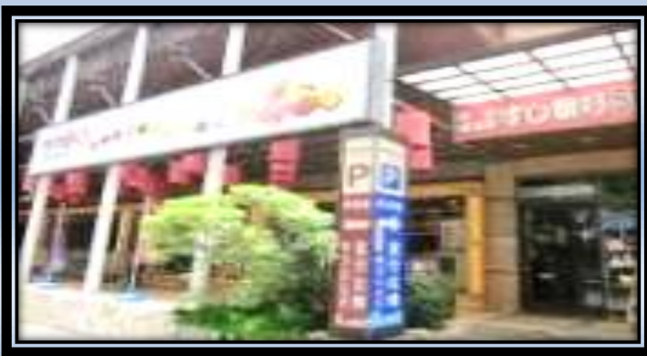
←回転寿司屋さん(大漁まぐろ)