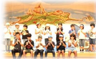
昨年度の学習発表会の様子

※この他、6年修学旅行、学年ごとの社会科見学、職場体験、地元小中学校との交流、文化的行事など様々な行事や活動が予定されております。学校だよりや学年だより等でお知らせいたしますのでご確認ください。